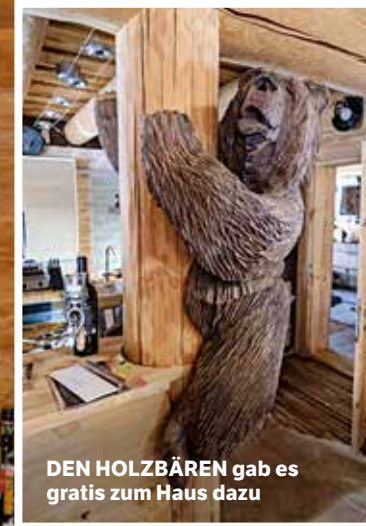
DEN HOLZBÄREN gab es gratis zum Haus dazu