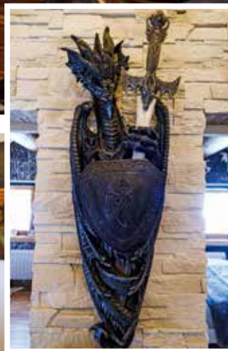
MYSTISCHES ACCESSOIRE Schwert und Drache