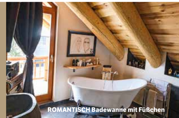
ROMANTISCH Badewanne mit Füßchen